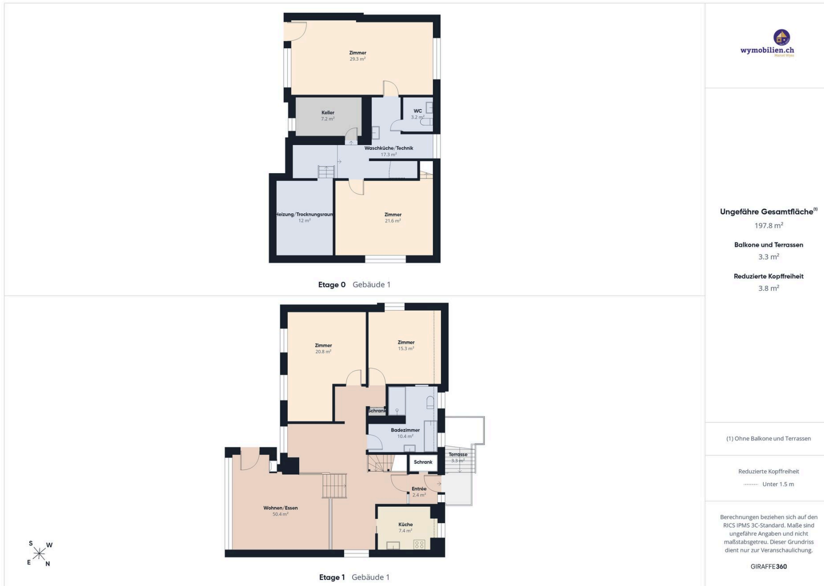
Grundriss der 2 Geschosse