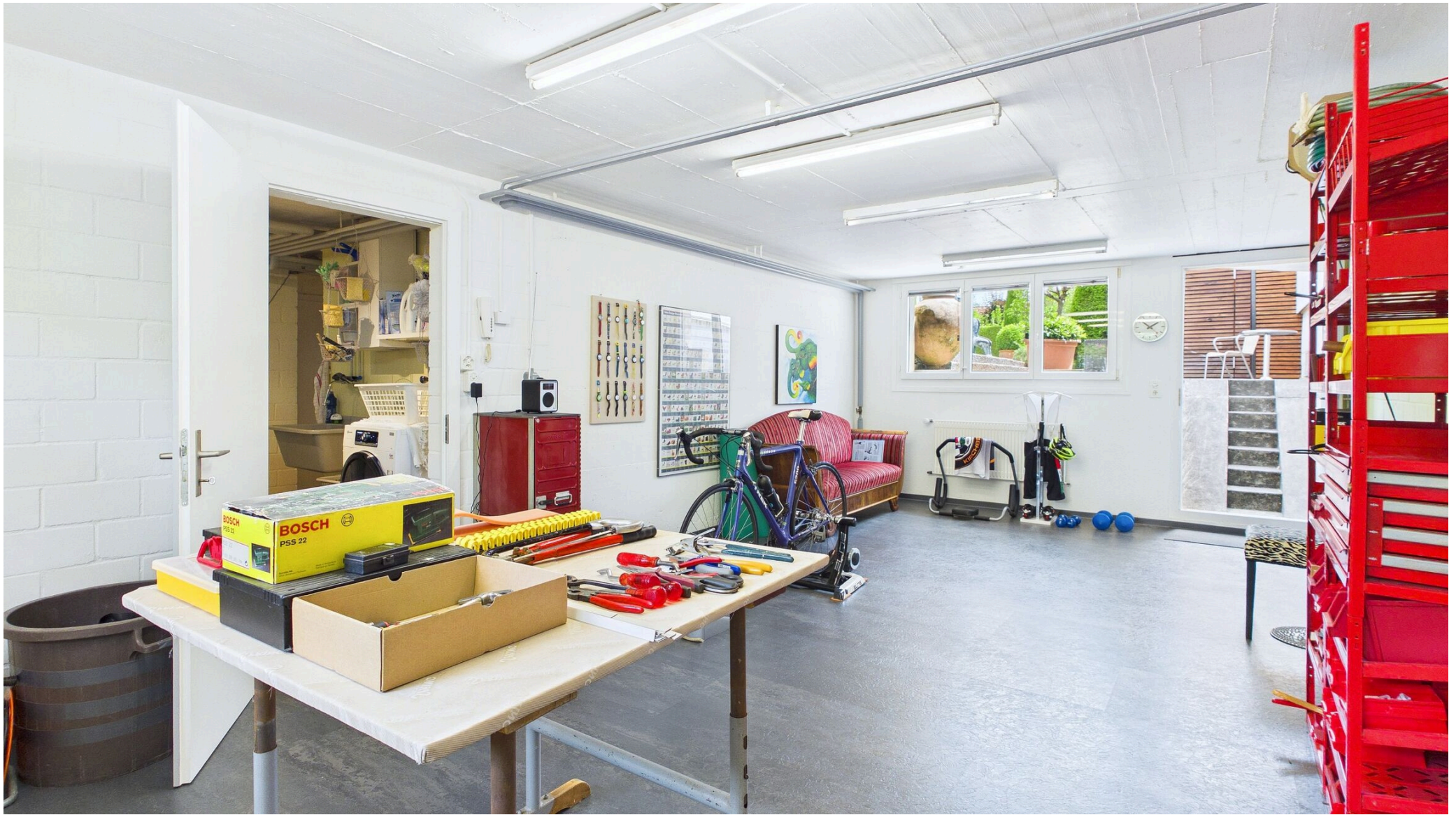
Zimmer UG mit Aussenzugang (früher Atelier)