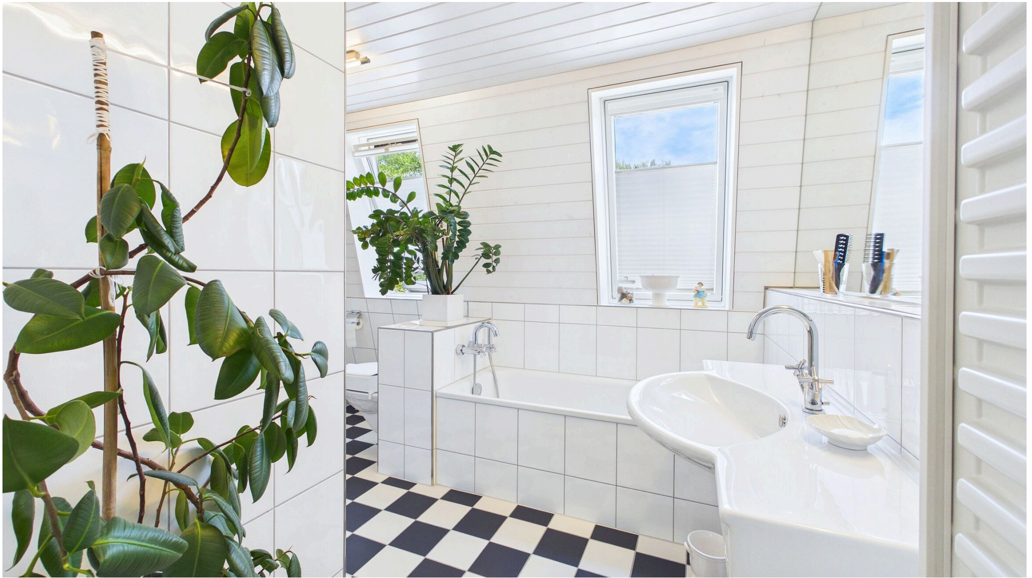
Bad mit Badewanne und Dusche