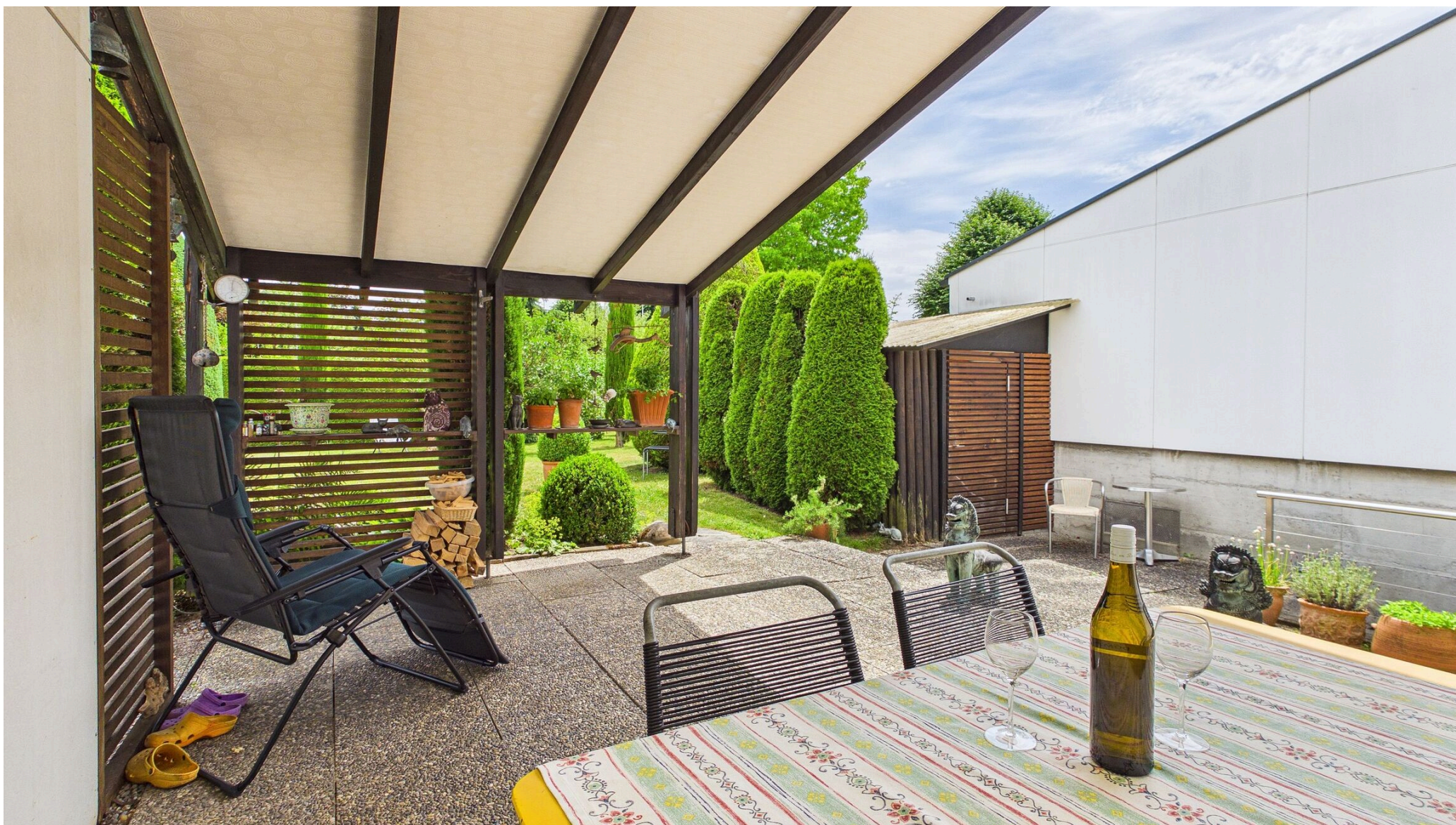
Die gedeckte Terrasse