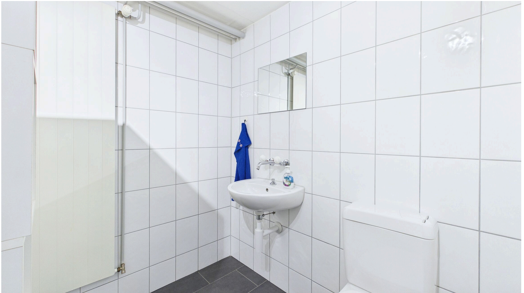
WC UG, Anschluss für Dusche vorhanden