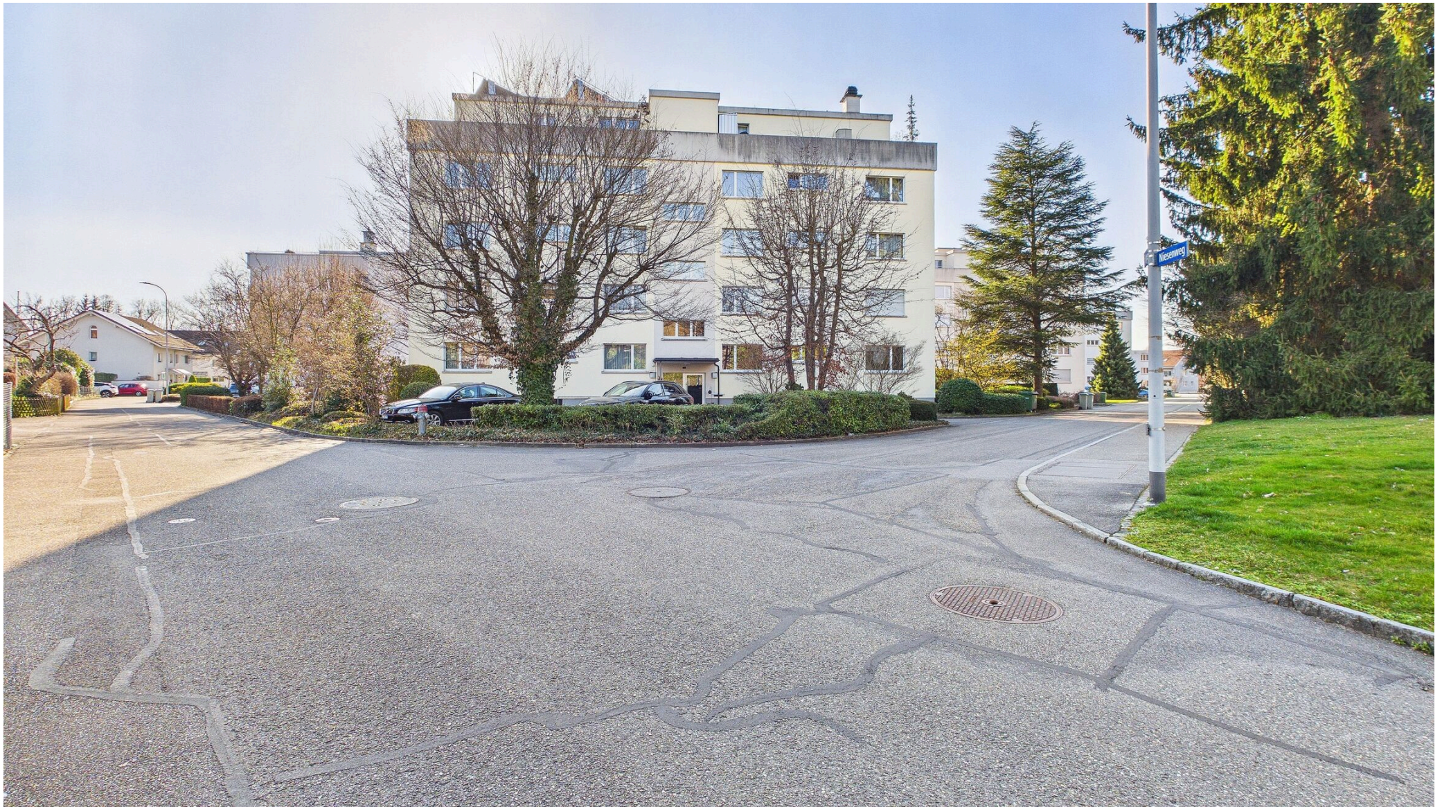
Ansicht MFH Eigerweg 8 (Nordost)