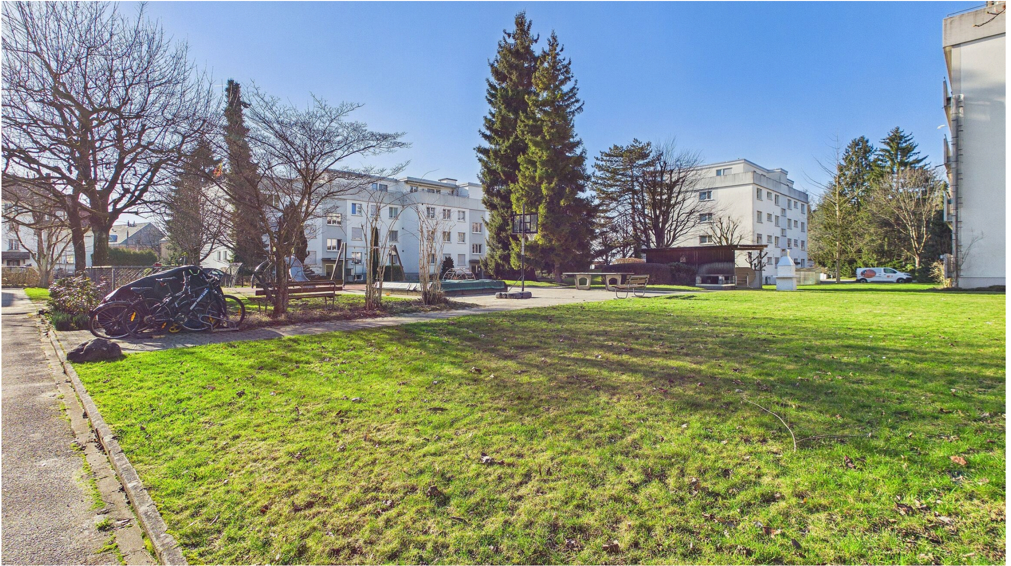
Grosse Grünfläche/Allgemeinfläche vor dem MFH