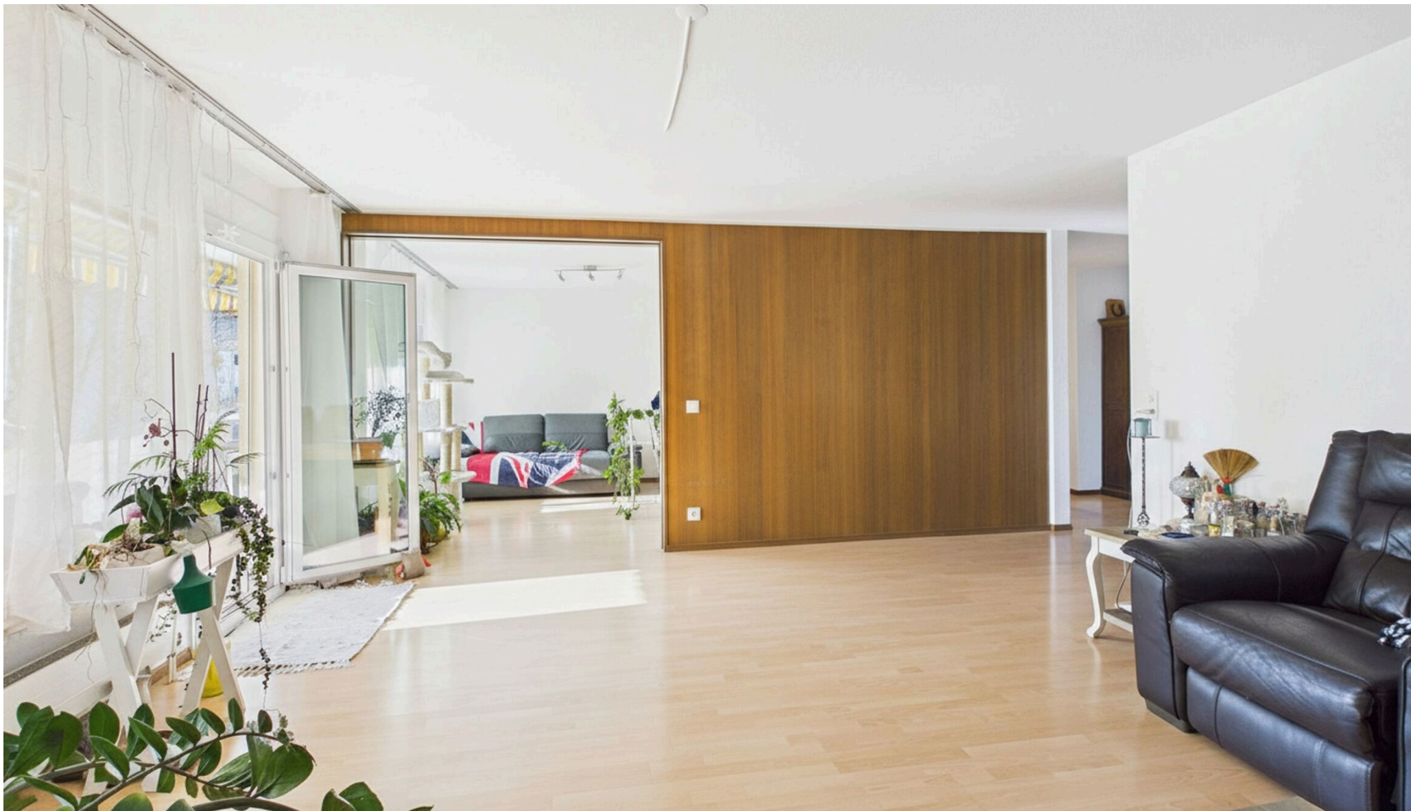
Essbereich mit Ausgang auf den Balkon