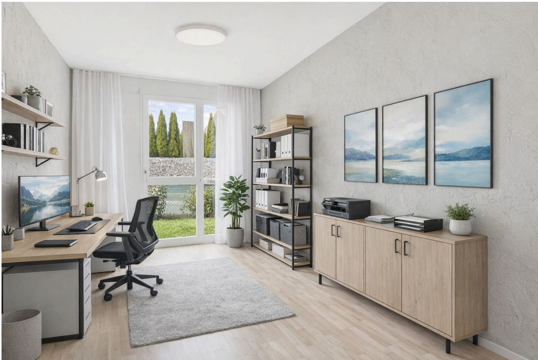
Zimmer 2 mit Möblierungsbeispiel