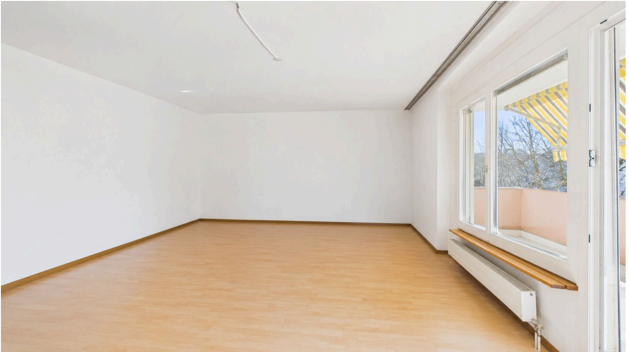
Wohnbereich mit Ausgang auf den Balkon