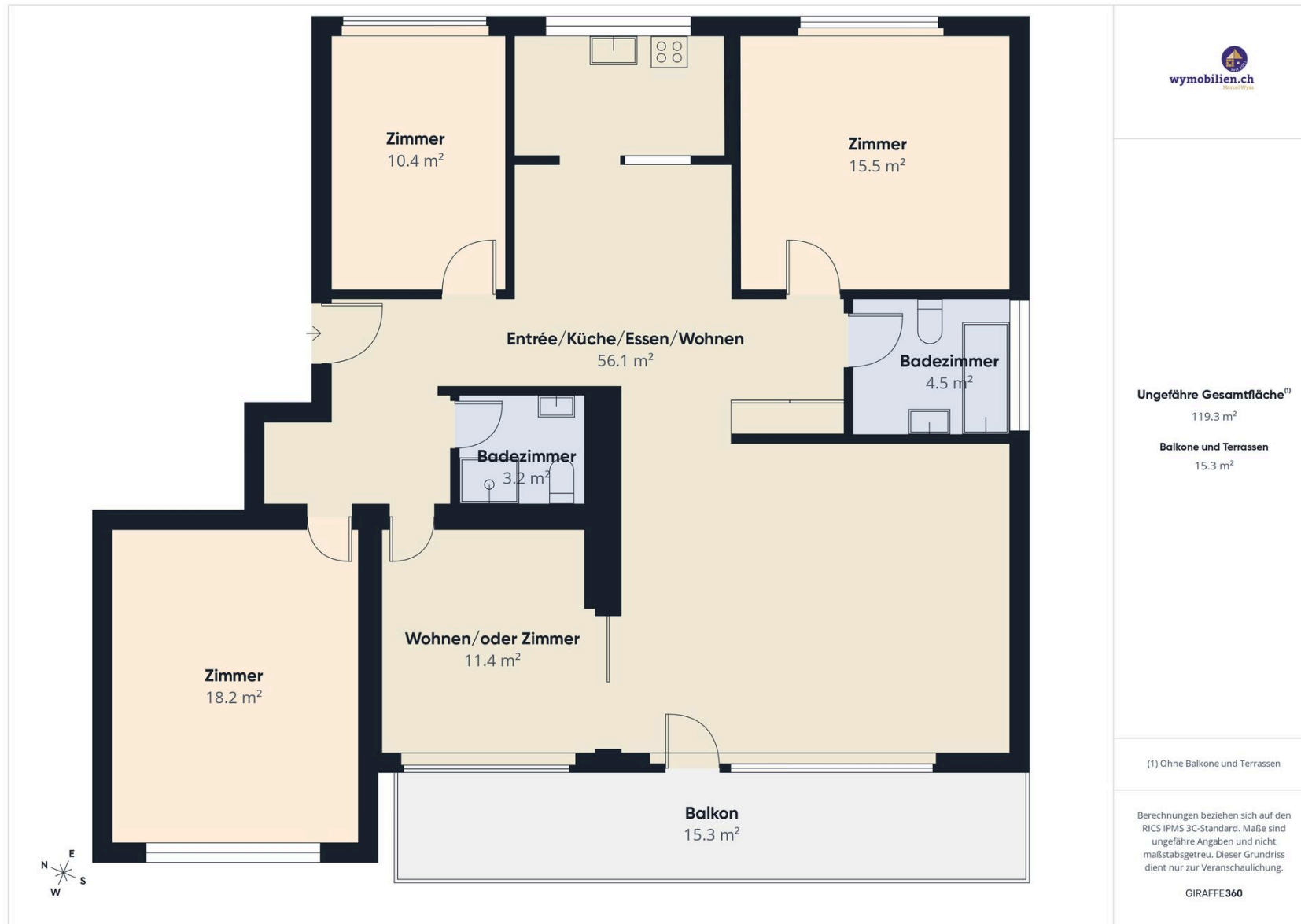
Grundriss der grosszügigen Wohnung