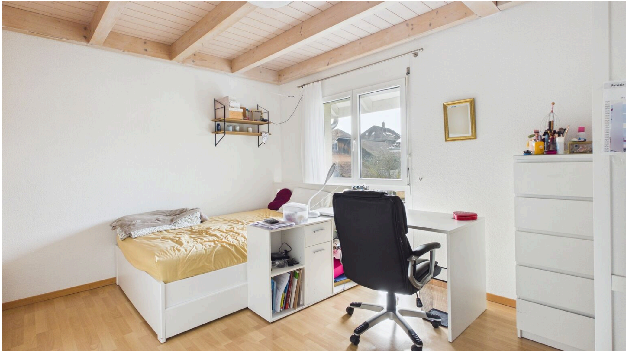
Zimmer OG mit Einbauschränk