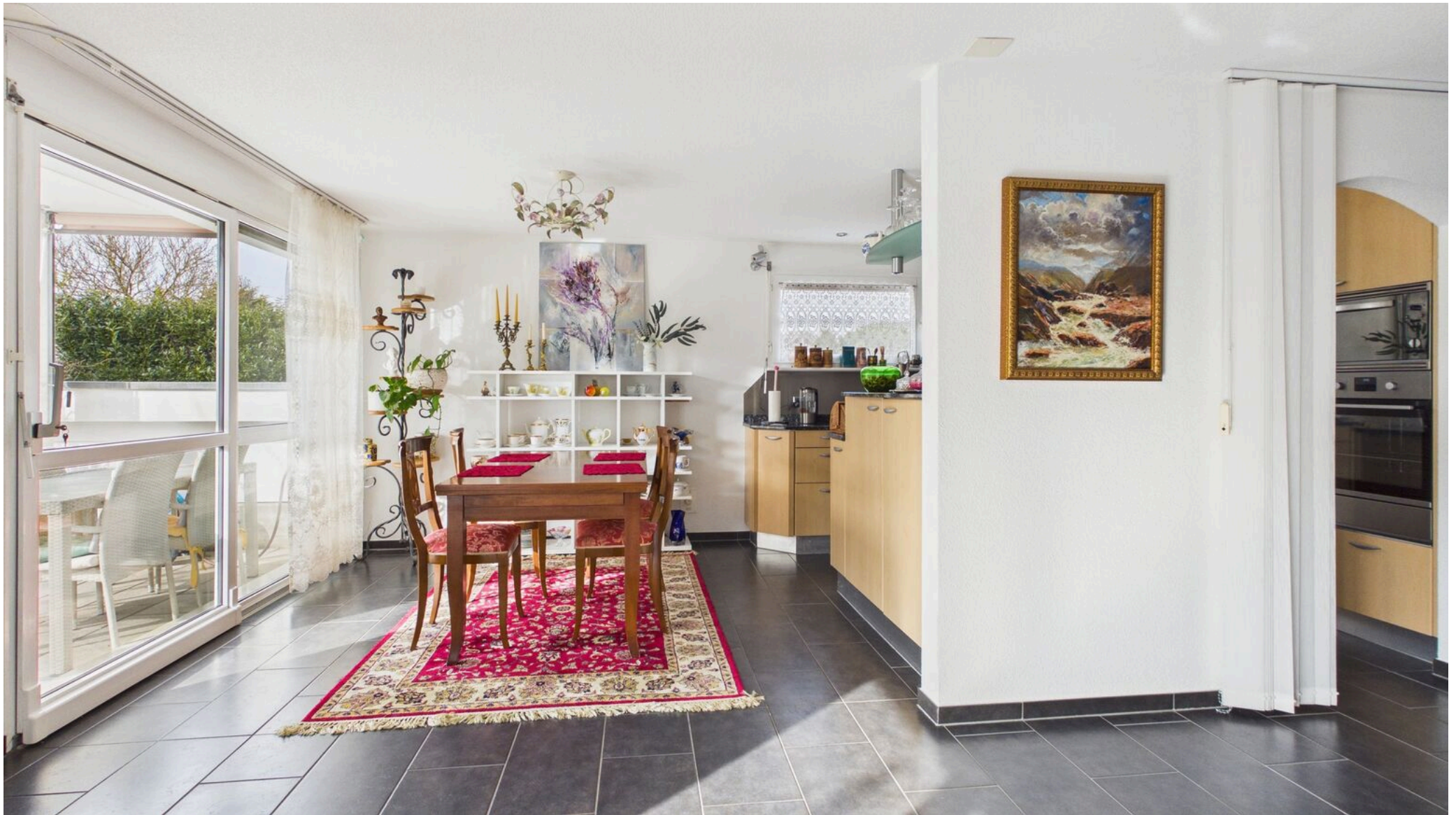
Essbereich mit Ausgang auf die Terrasse/Garten