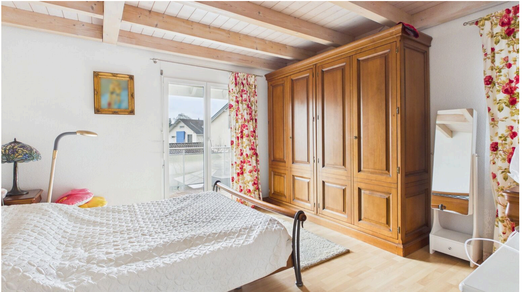
Zimmer OG mit Ausgang auf den Balkon