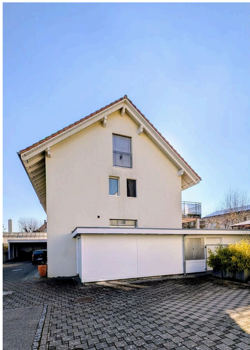
Fassade Nord mit Garage/Parkplatz und Aussenzugang zum Garten