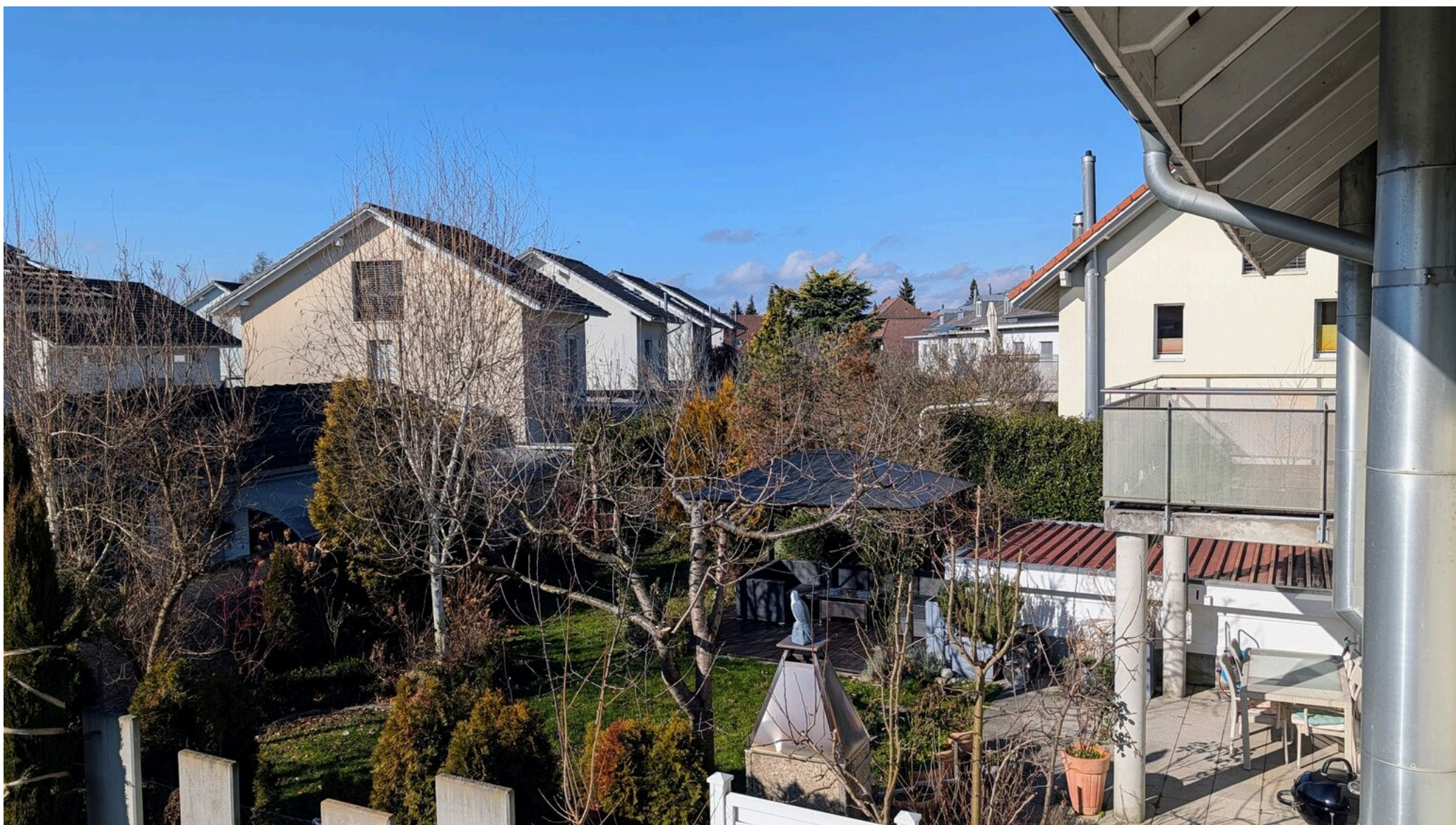
Blick auf die Terrasse und den Garten