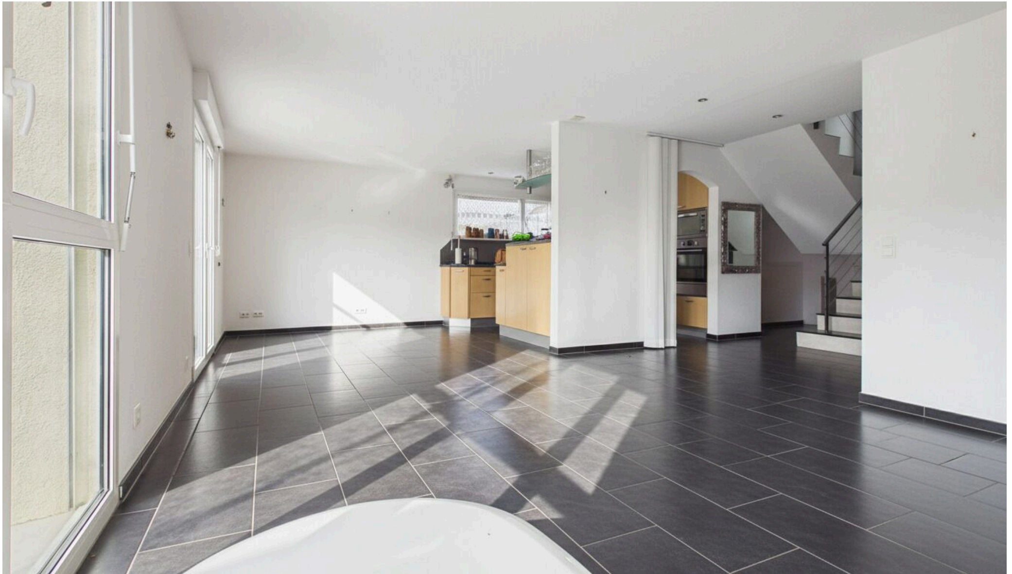
Wohnbereich ohne Möbel und Schwedenofen