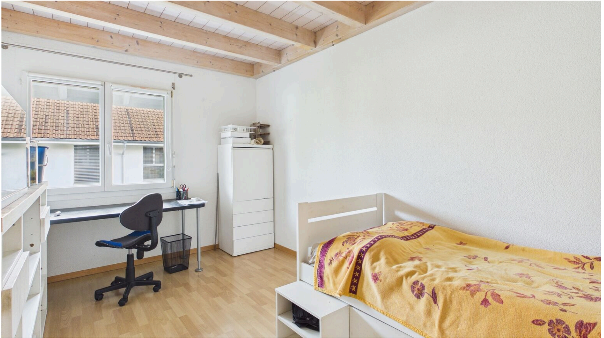
Zimmer OG mit Einbauschränk