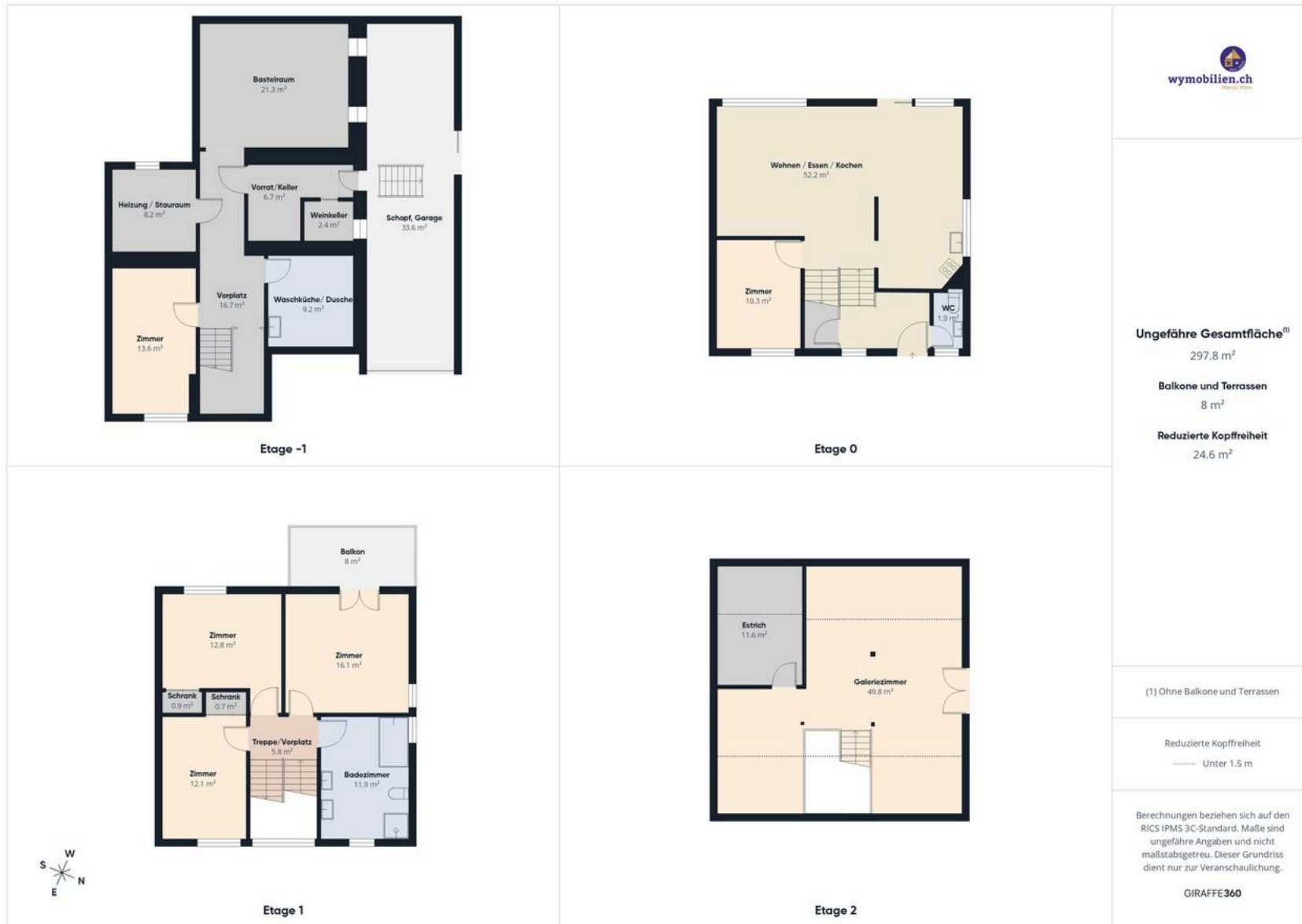
Grundrisse des DEFH