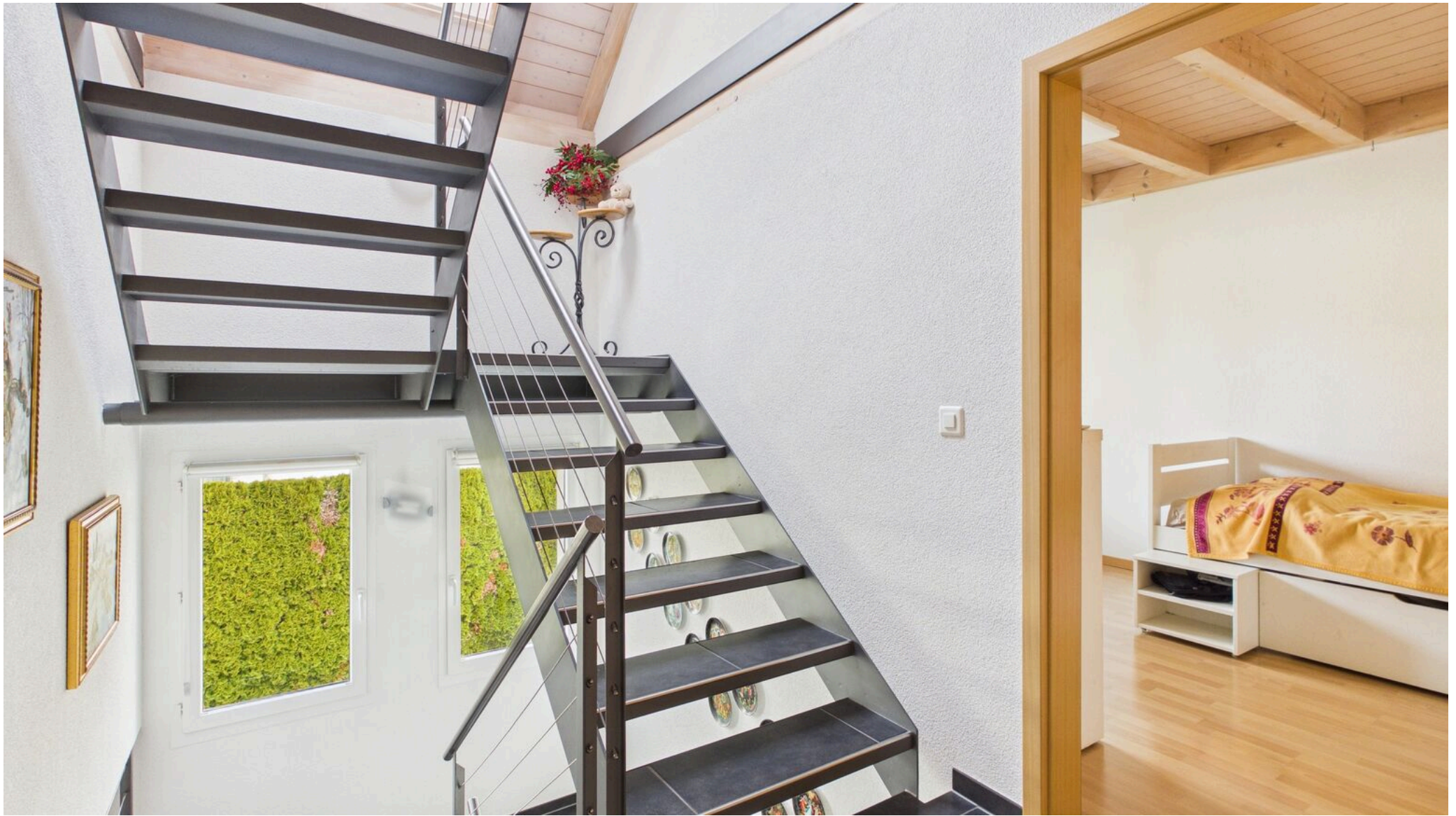
lichtdurchfluteter Aufgang ins OG