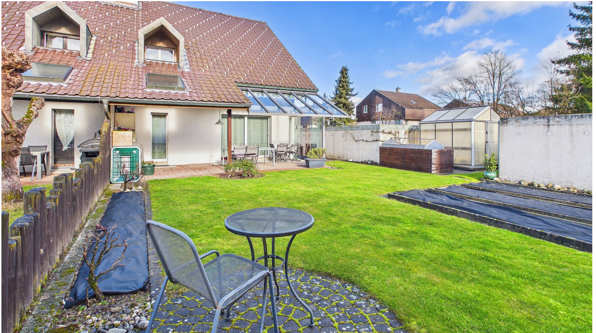
Grosser Garten mit Grünfläche, Gartenbeete, Hochbeet, Gewächshaus