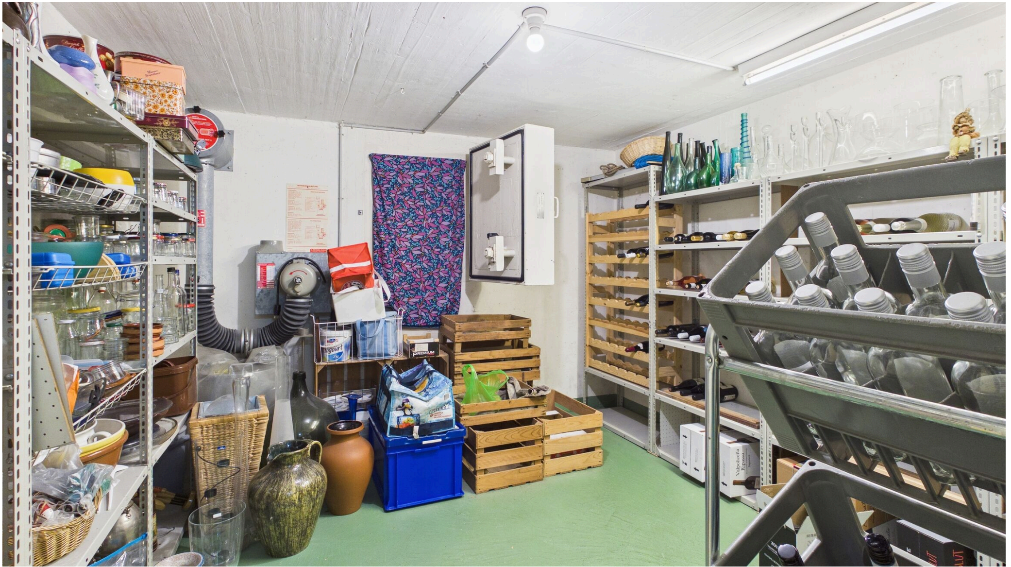
Keller (Schutzraum) UG