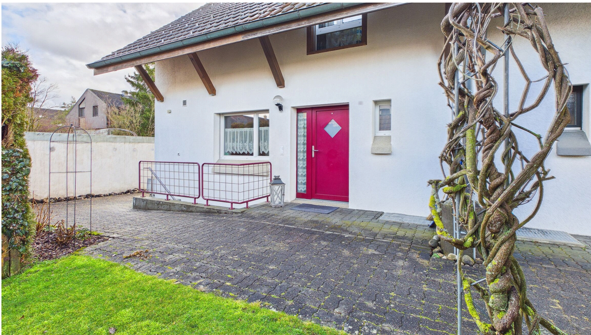
Zugang/Eingang EG sowie Aussentreppe ins UG