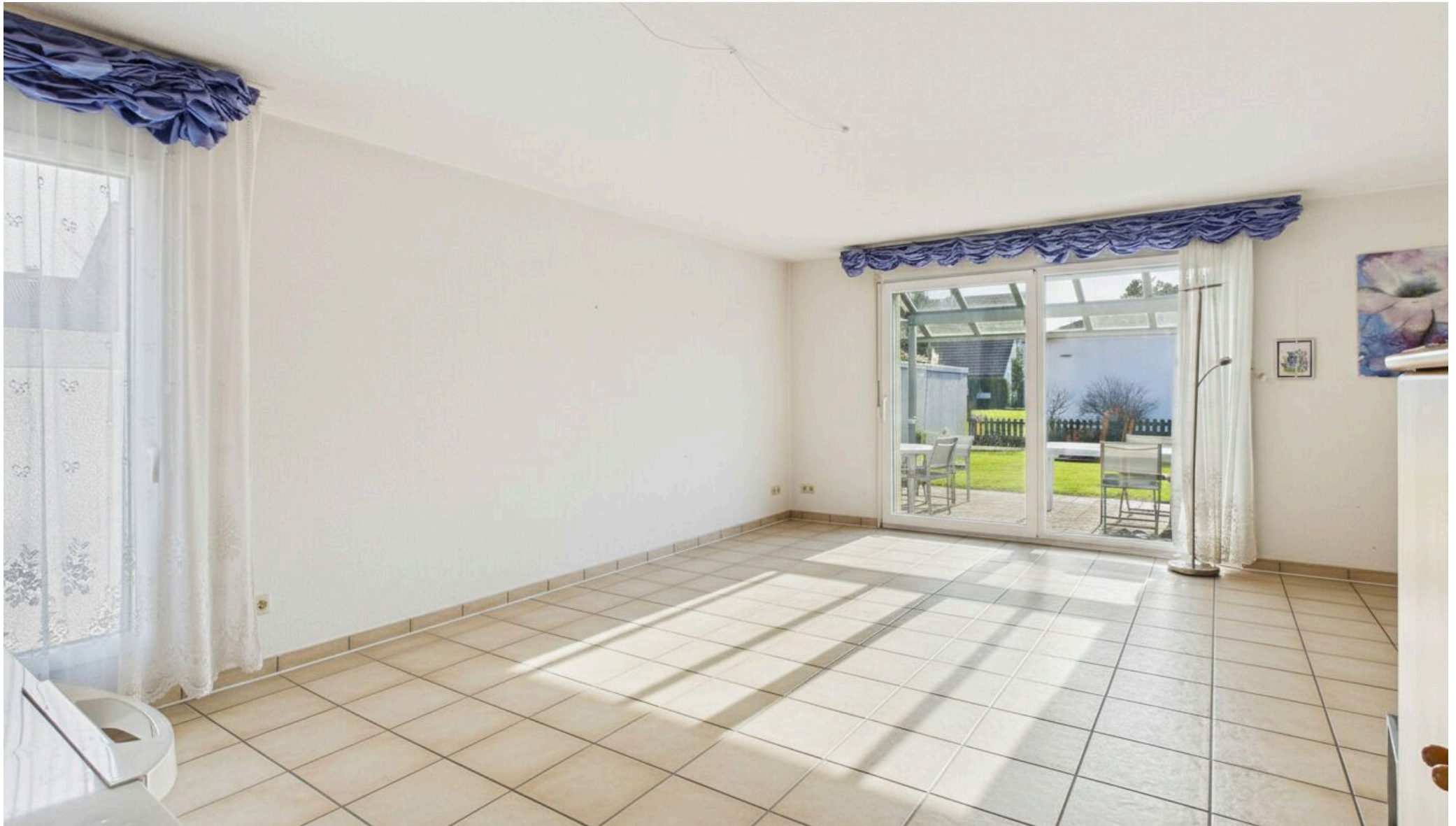
Essbereich mit Ausgang auf die Terrasse (Möblierung mit KI entfernt)