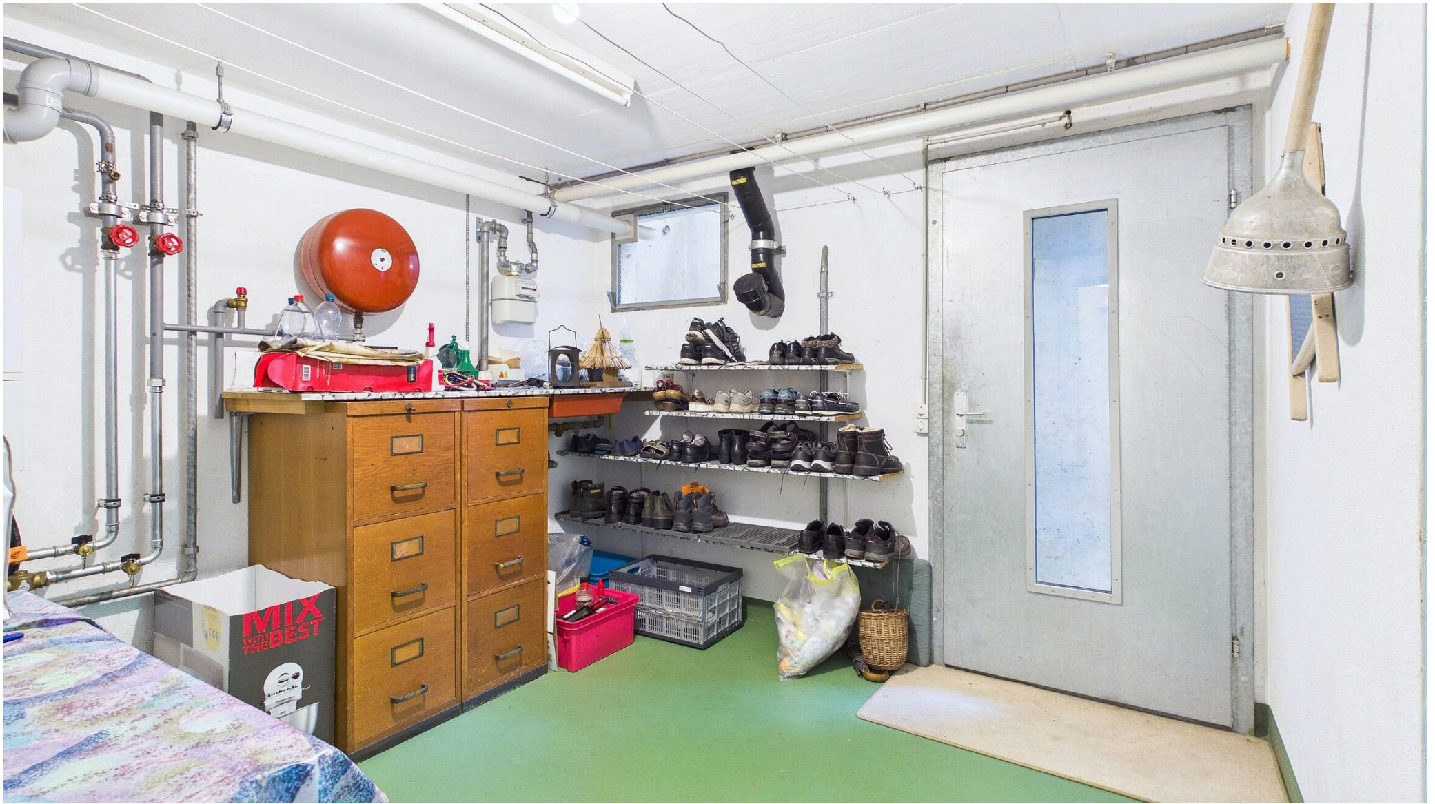
Allzweckraum UG mit Aussenzugang