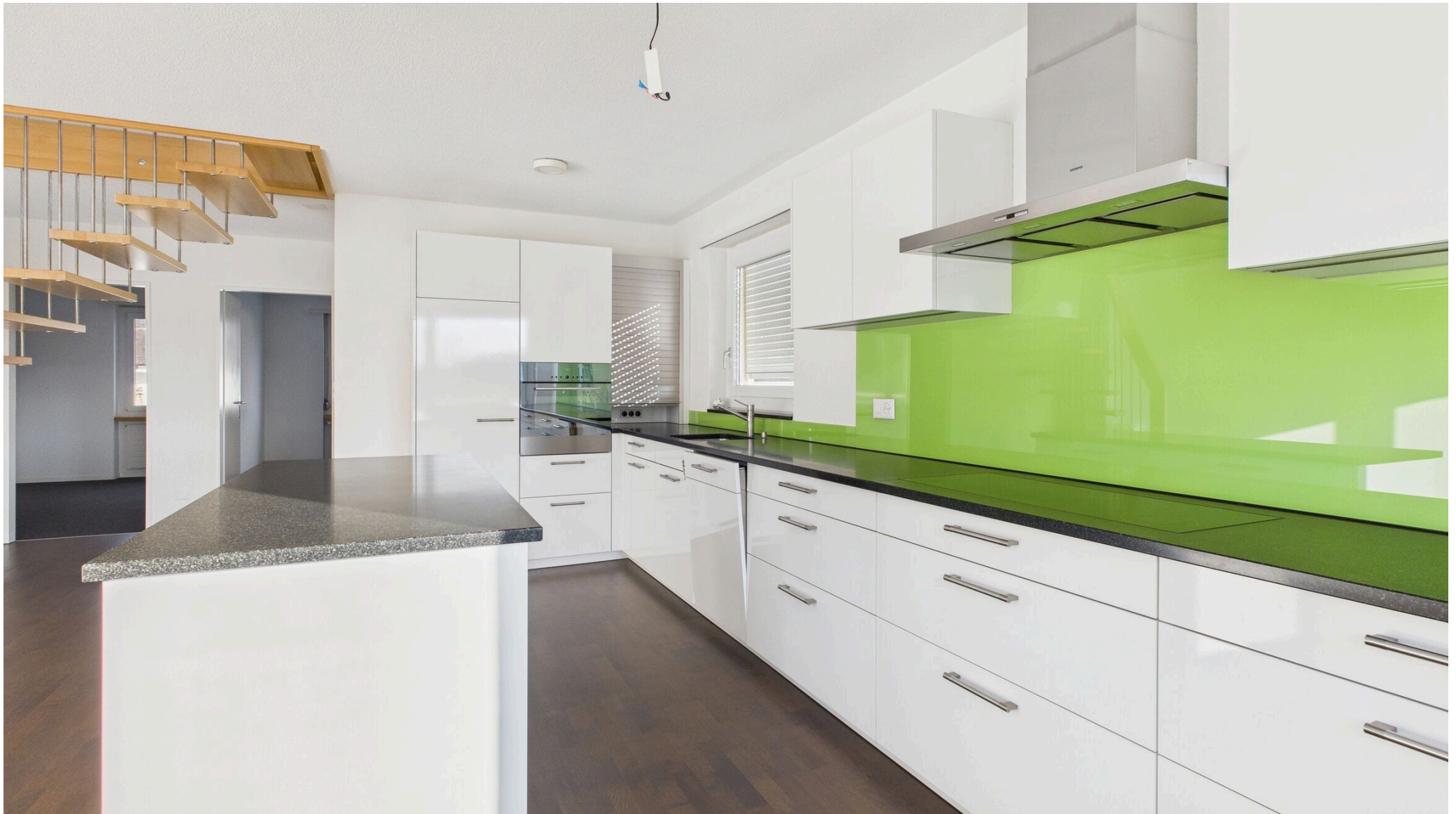
Die moderne, grosszügige Küche