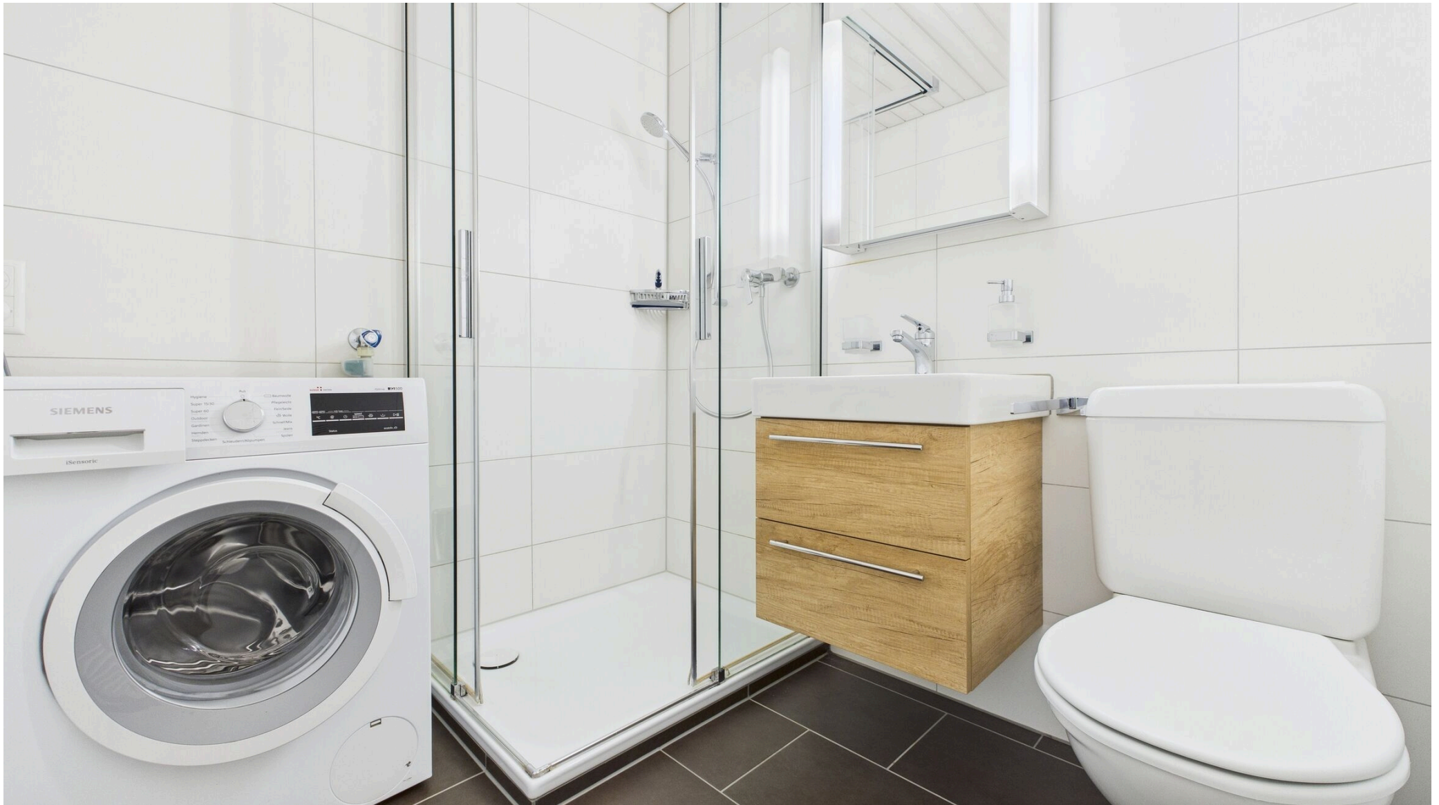
Bad mit Dusche und Waschmaschine