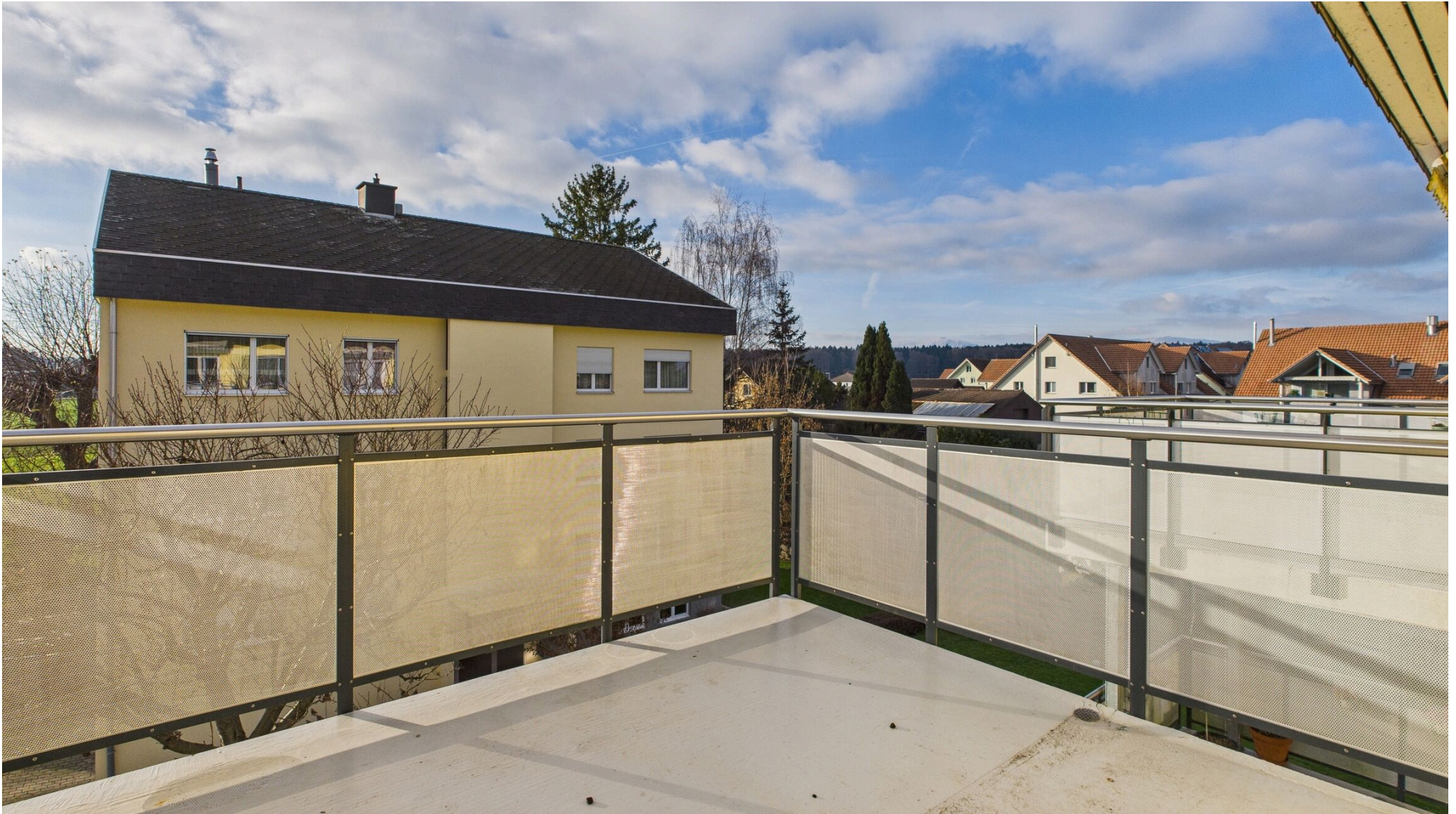
Vom Wohnbereich direkt auf den Balkon mit Abendsonne