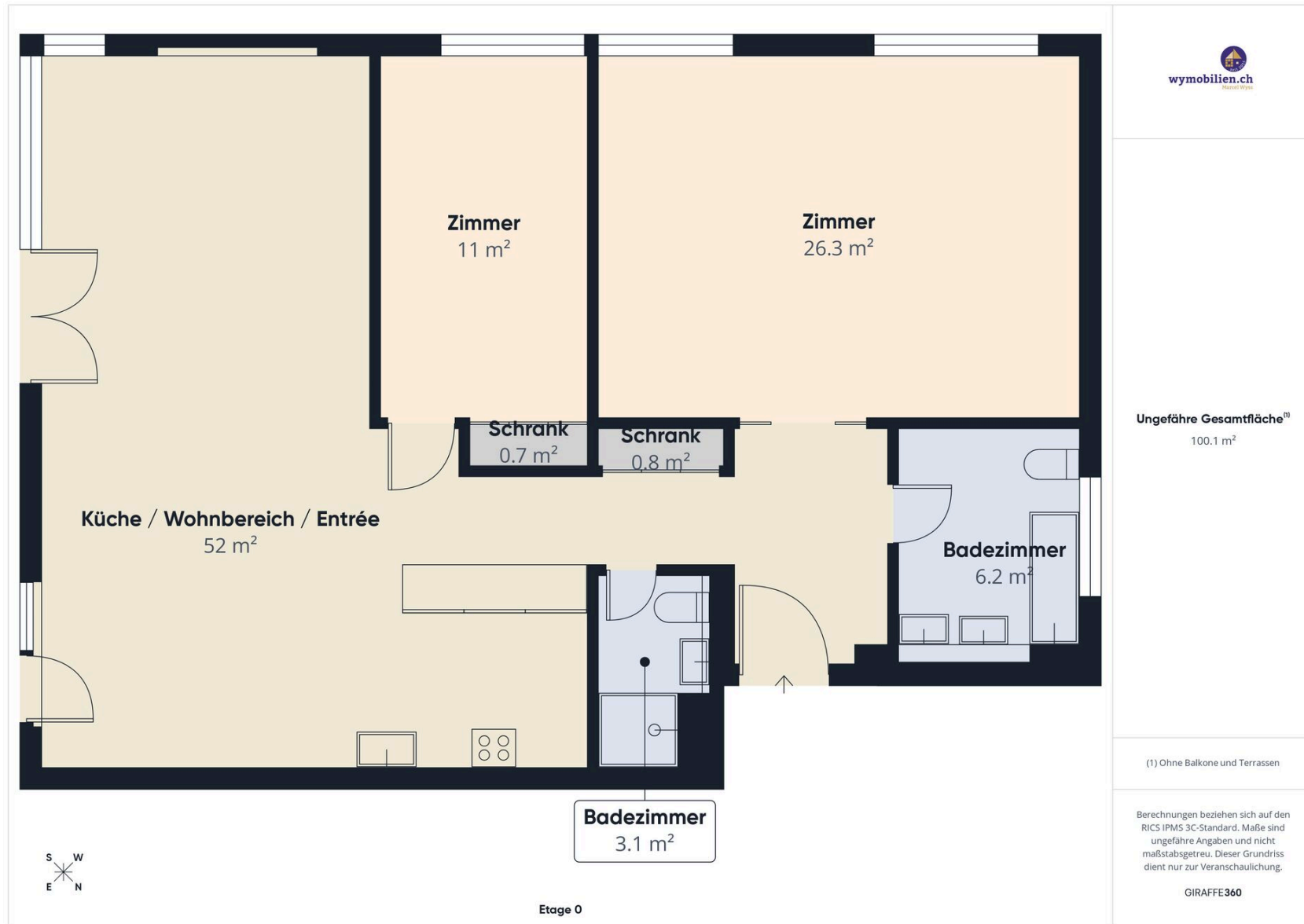
Grundriss der Wohnung