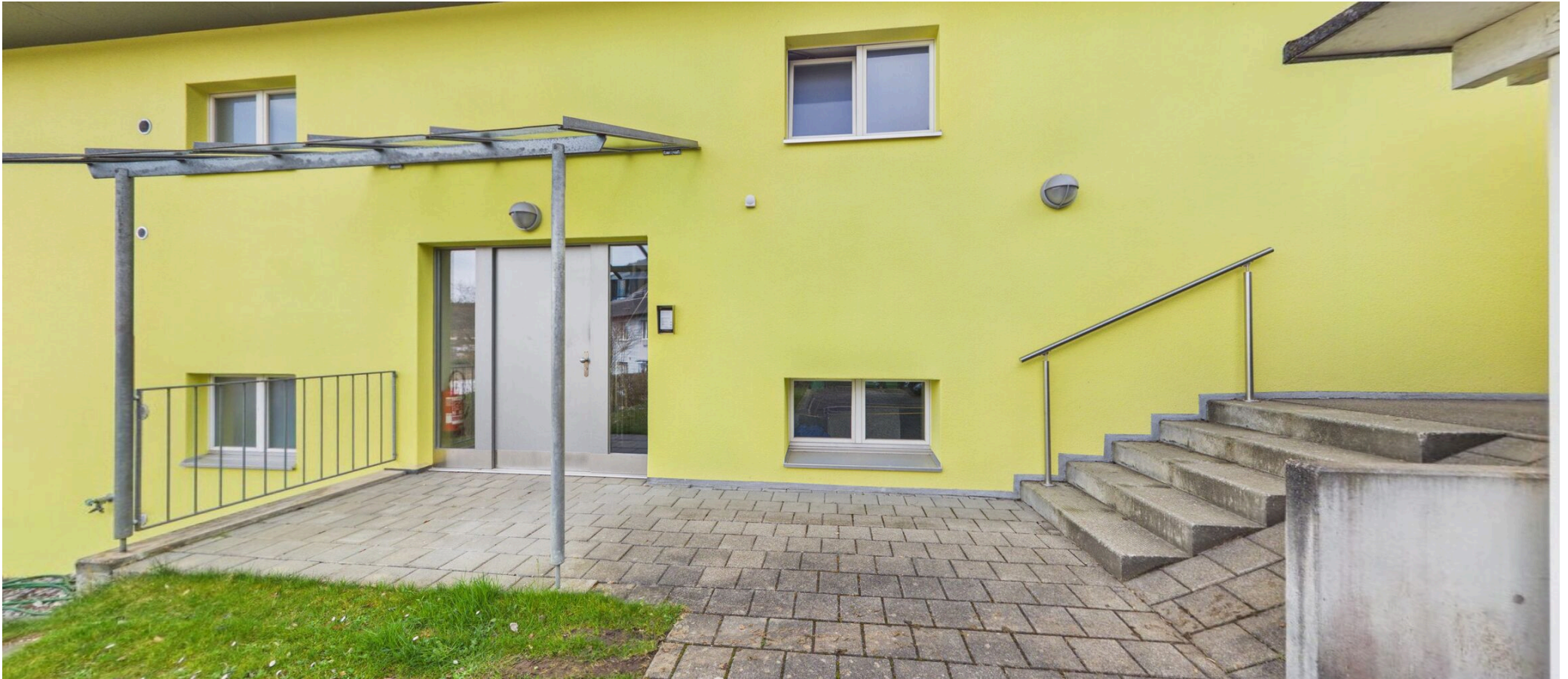
Eingangsbereich mit Carports (Nord)