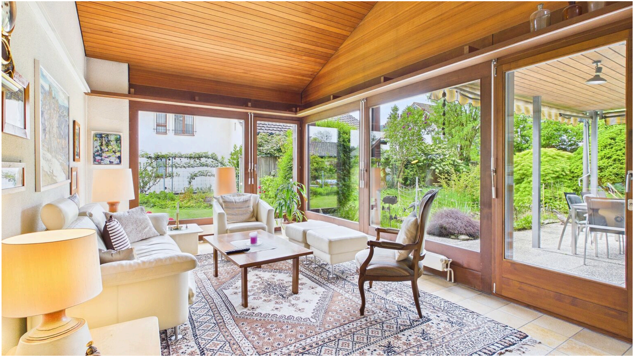
Wohnen / Ausgang Sitzplatz