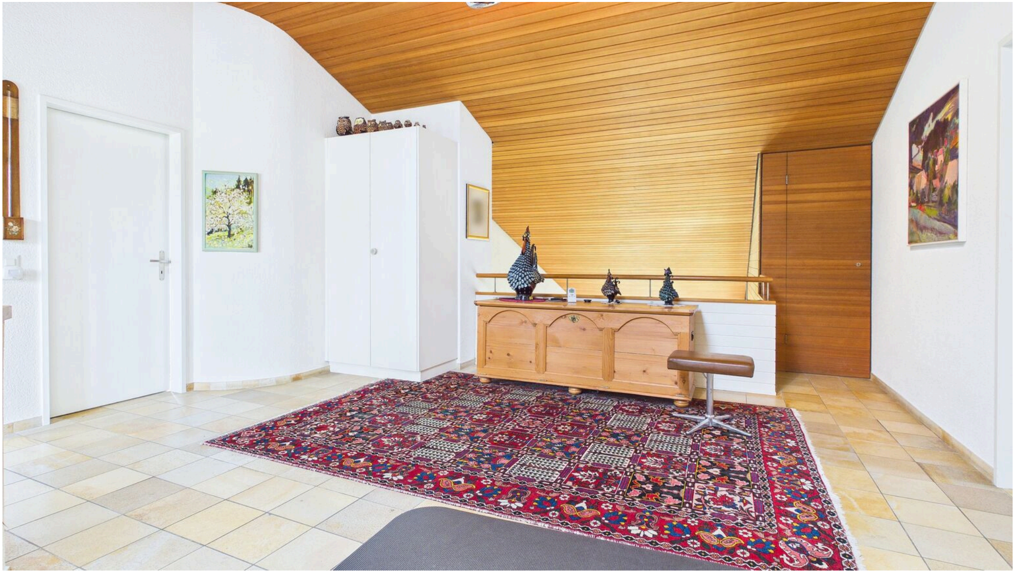
Vorplatz Galerie OG