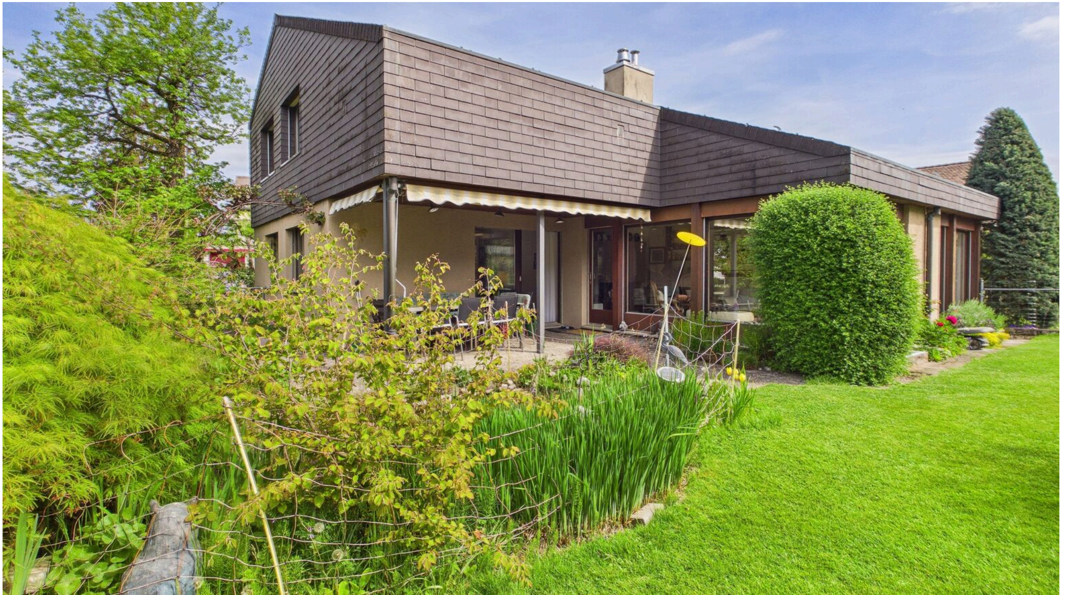
Gedeckter Gartensitzplatz am Teich