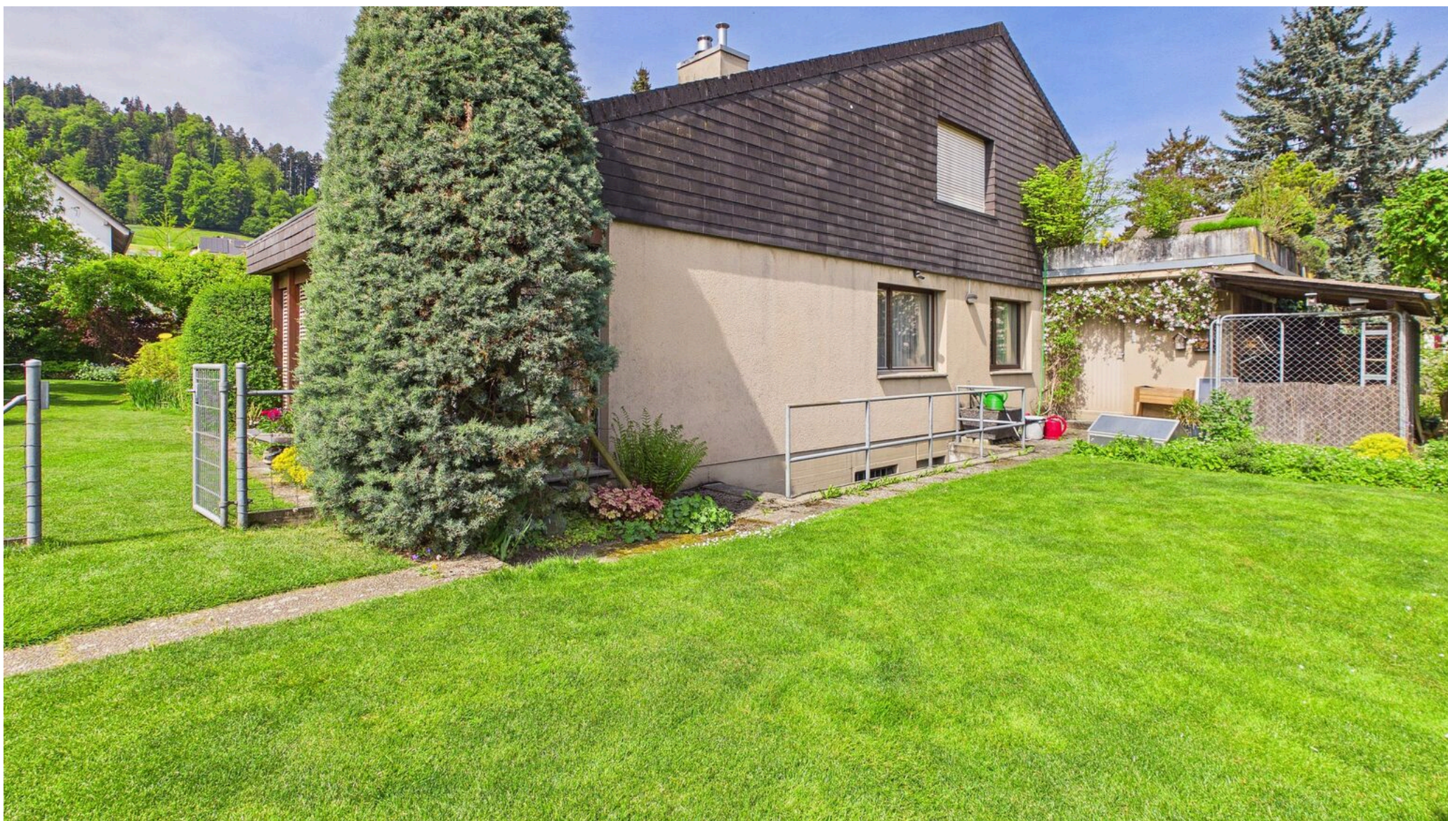
Garten und Aussenzugang UG