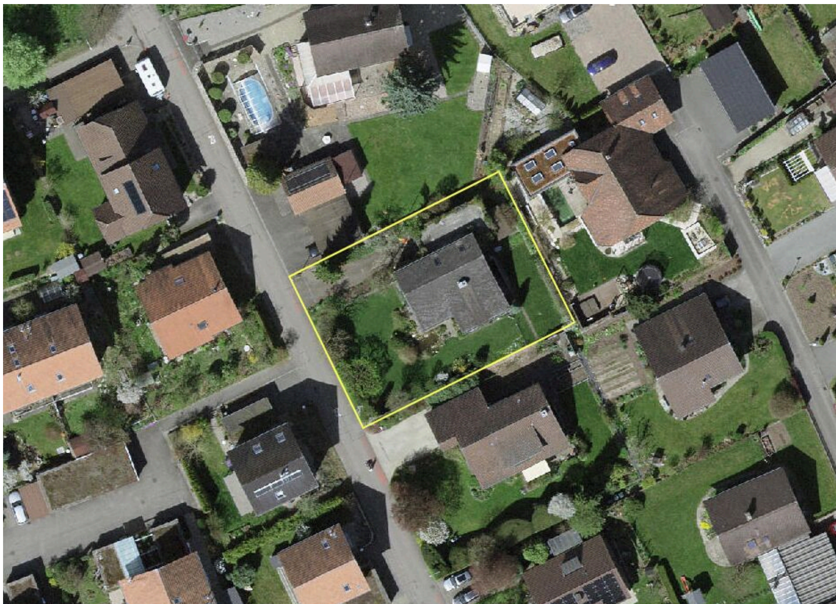
Parzelle mit 874m 2