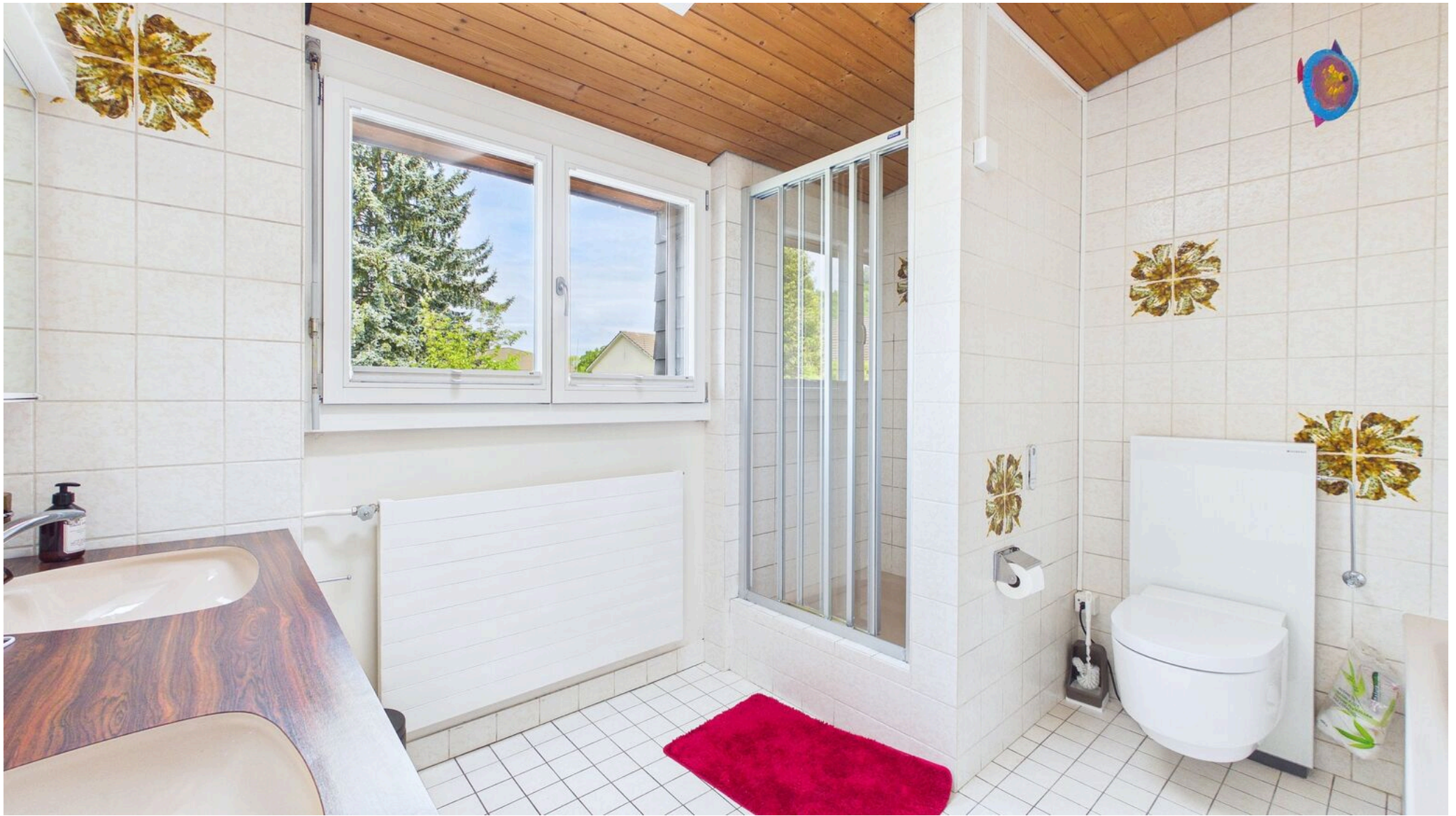
Bad mit Dusche/Badwanne