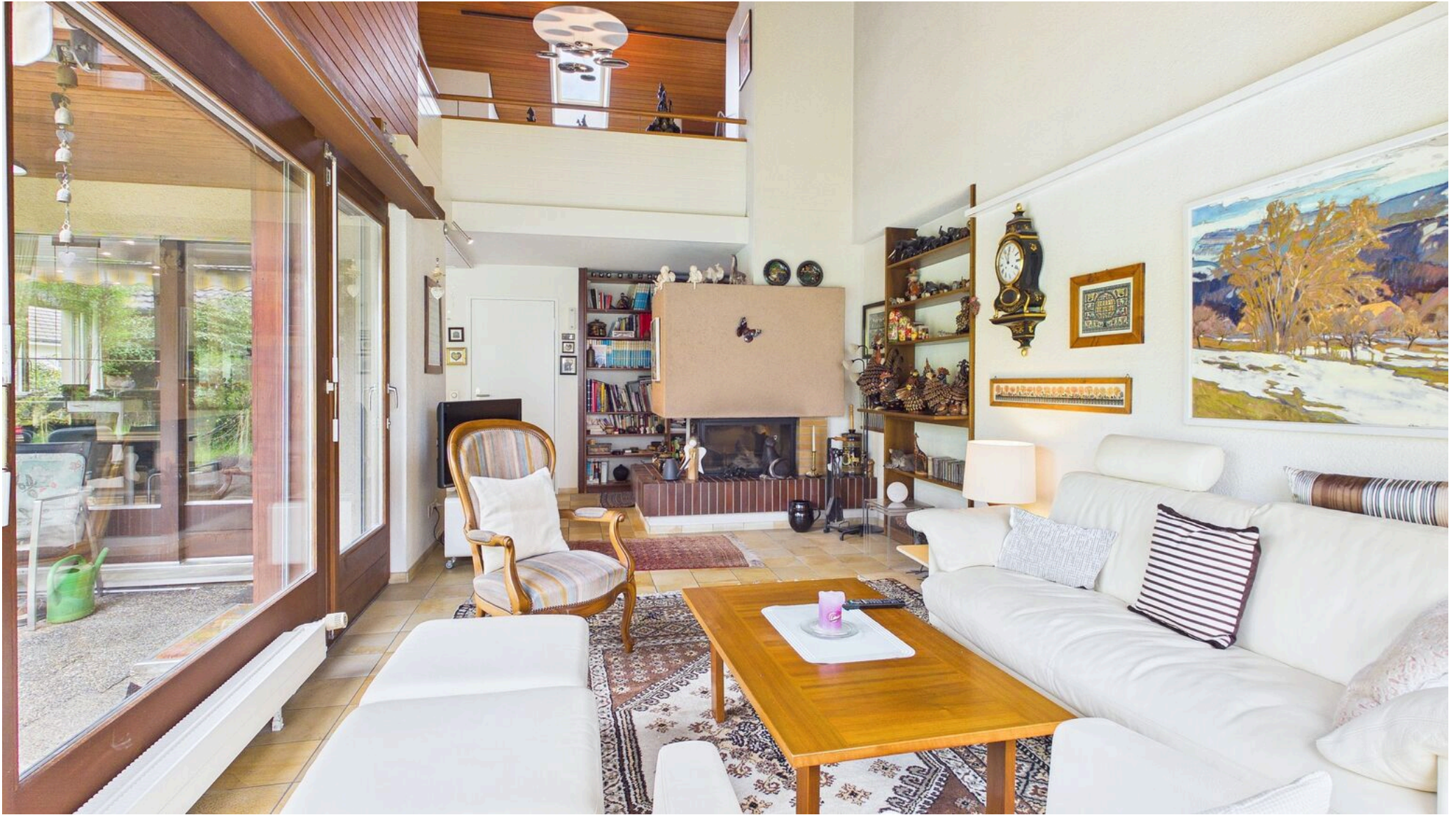
Wohnen / Galerie