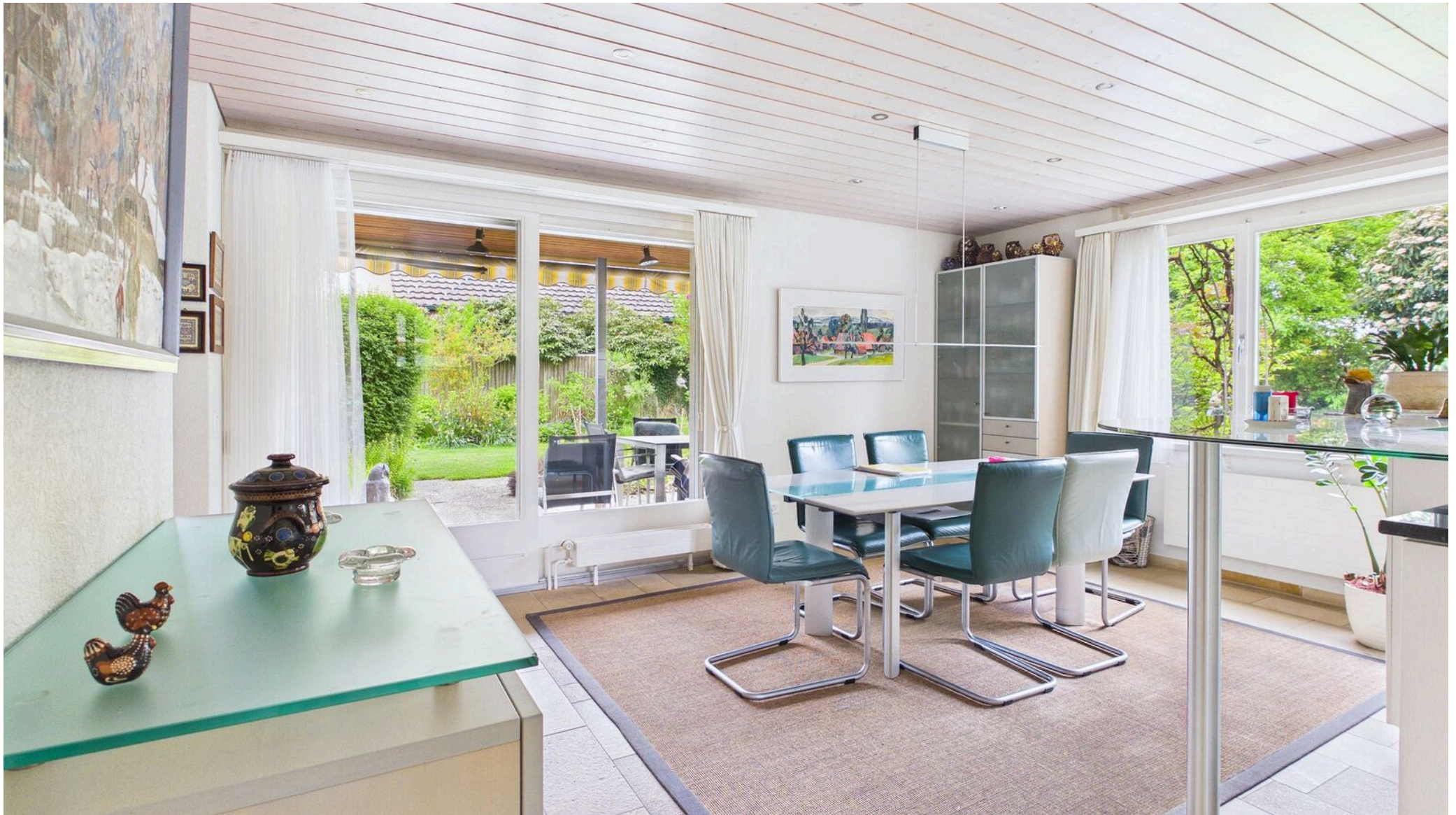
Lichtdurchfluteter Essbereich/Ausgang Sitzplatz